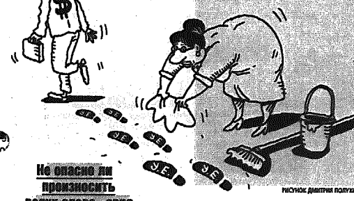
Но опасно ли прозвучит слово «евро»

Недавно депутаты Государственной Думы РФ приняли в первом чтении законопроект о запрете упоминания в сообщениях о ценах в иностранной валюте и условных единицах.