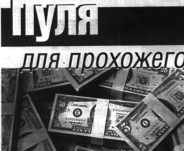
Пуля для прохожего