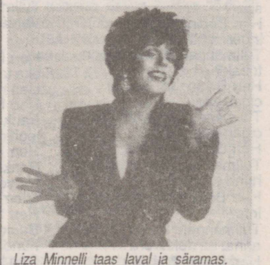
Liza Minnelli taas laval ja säramas.