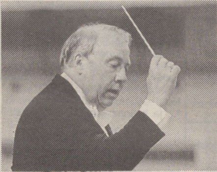
Dirigeerib Neeme Järvi.