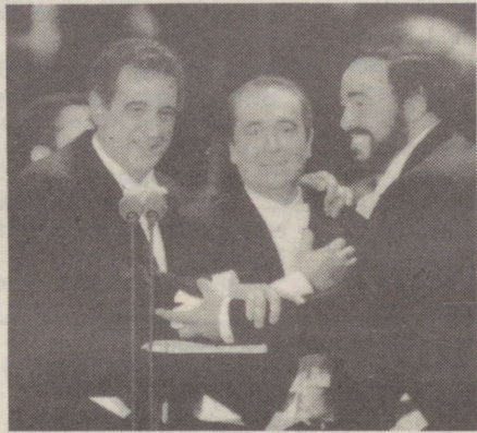
Esinevad José Carreras, Plácido Domingo ja Luciano Pavarotti.

22.05 KOLME TENORI KONSERT Los Angeleses 16. juulil 1994