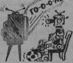
Рис. В. СТАРАДЫМОВА.