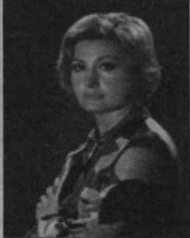
Людмила Максакова, «Неподсуден», мелодрама.