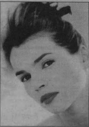
Джулия Ормонд, «Легенды осени», драма.