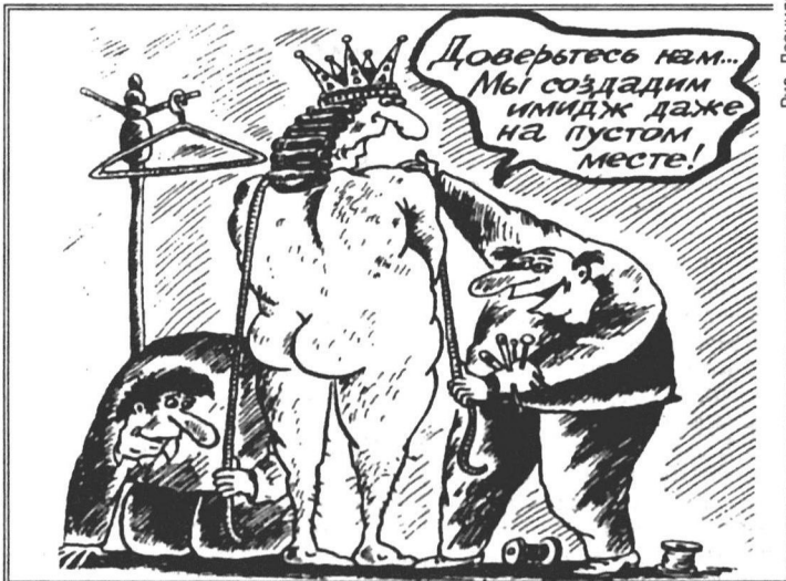
Рис. Леонида МЕЛЬНИКА