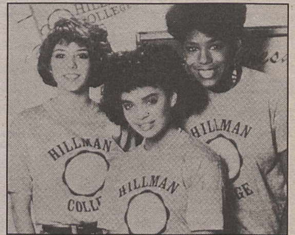
Lisa Bonet, fyrir miðju, leikur aðalpersónuna í Vistaskipt- um, Denise Huxtable.