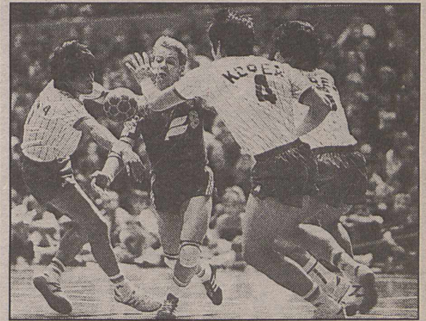
Íslenska landsliðið í handknattleik.