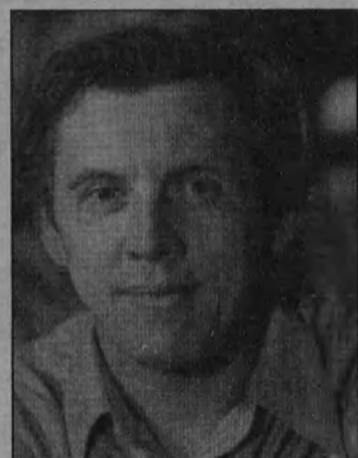
Валерий Золотухин, «Бумбараш», военный фильм.

11.00 «Катаклизм-2000» (США, 1985). 11.20 «Все начинается с дороги» (СССР, 1960).