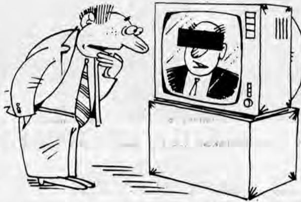
Рис. Н. ГИРГЕЛЯ

17.45 "Снег — судьба моя". Премьера док.фильма. 2-я серия. 18.45 Праздник каждый день. 19.00, 22.00 Вести. 19.25 "Санта Барбара". Худ. фильм. 20.20 Студия "Сатирикон". 20.50 Экран криминальных сообщений. 21.00 Отчет о работе VII Съезда народных депутатов Российской Федерации. В перерыве /22.25/ — Спортивная карусель.