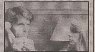
James Fox og Jane Asher leika aðalhlutverkin í Strokubörn.

Í byrjun myndarinnar hverfur ellefu ára stúlka, Rakel. Hjólið hennar finnst en stúlkan hefur gafað upp. Eftir að alri leit hefur verið hætt og móðirin gefið upp alla von um að finna barnið heldur þaðirinn áfram leitinni. Hann er handviss um að dóttir hans sé á lifi og að hún sé víðriðin unglíngalæpastarfsemi, trúarof-