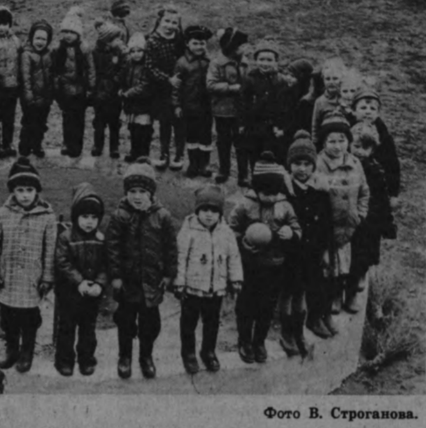
КОЛЛЕКТИВНЫЙ ПОРТРЕТ.