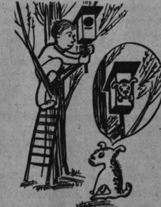
Непонятно песне — «Для чего он кокуру Крестит на осине?». О. ДЕЛОВ, Рис. С. Переяевой.

У соседа есть щенок — Симпатичный малый. Вот однажды со всех ног По двору бежал он.