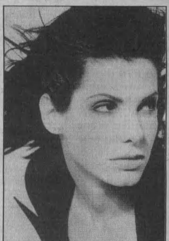
Сандра Баллок, «Амазонка в огне», боевик.

10.00 «Амазонка в огне» (США, 1991). Боевик. 6-й канал. 10.15 «Плачущий убийца» (США, 1995). Фантастический боевик. 31.