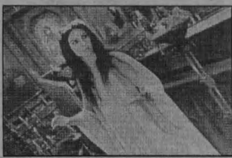
Наталья Варлей в роли Паночки в фильме «Вий».