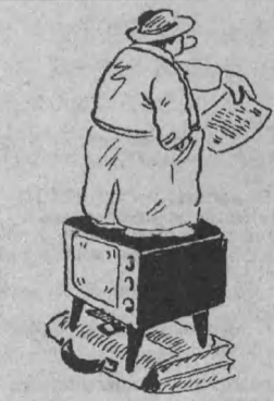
Рис. В. СТАРАДЫМОВА.

15.50 «Цыганка Аза» (Украина, 1987). Драма. 12. 17.00 «Гараж» (СССР, 1979). Комедия. 28. 18.15 «Возвращение Баттерфляй» (СССР, 1982). 4.