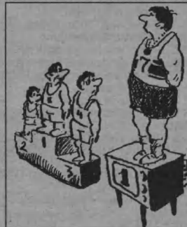
Рис. В. СТАРАДЫМОВА.

МузТВ 8.00, 9.00, 10.00, 11.00, 12.00, 13.00, 14.00, 15.00, 16.00, 17.00, 18.00,