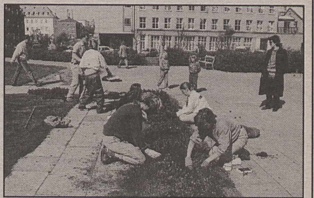
Unglingavinna í bæjum er fólgin í hreinsun, gróðursetningu og fleiru.