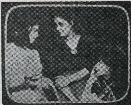
Сцена от „Чудаци“ — постановка на Телевизионния театър

Това е експеримент. Дали ще успеем, не можем да гадаем. Едно е сигурно: работата над „Чудаци“ ще бъде школа за целия ни творчески колектив.“