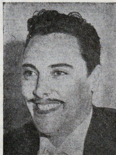
Марио дел Монако

12.50 Забавни минути с оркестъра на Мантовани: 1. Молитвата на Тоска из оп. „Тоска“ (Пучини); 2. Вариации из „Карнавал във Венеция“ (Милер); 3. Теми от Италианско капричио (Чайковски); 4. Неблагодарно сърце (Кардило)