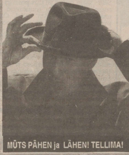
MÜTS PÄHEN ja LÄHEN! TELLIMA!

Lp. huvilised, palun kirjutage, mida uut sooviksite lehes näha.