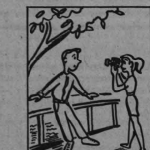
Фотографии, возможно, получились бы хорошие, если бы девушка не забывала переворачивать пленку. А теперь все снимки оказались на одном кадре. Сколько их было сделано?