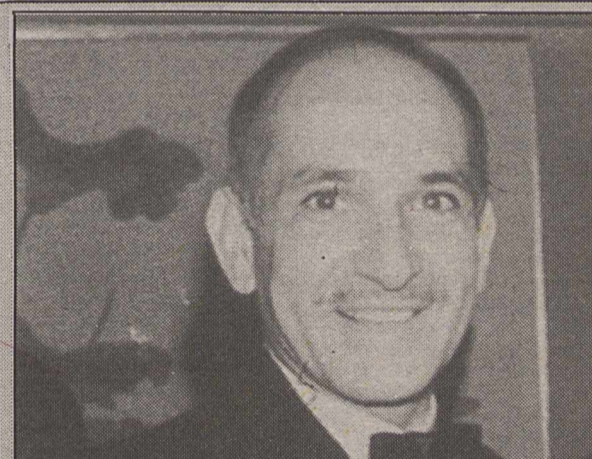
Meðal leikara í Leyndardómum Sahara er Ben Kingsley.