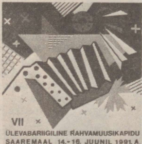
VII ÜLEVABARIIGILINE RAHVAMUUSIKAPIDU SAAREMAAL 14.-16. JUUNIL 1991. A.

Saaremaa kultuuripäevade avamänguks on VII eesti rahvamuusikapäevad.