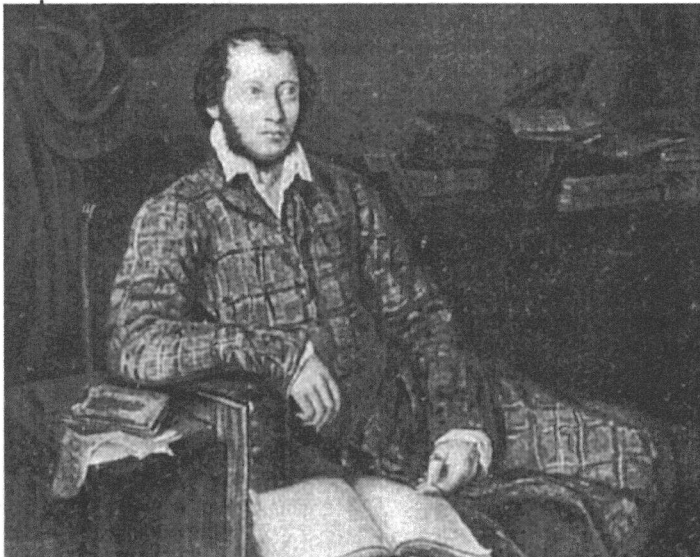
Идея проекта в том, что века оставляют о себе память будущему поколению

В рамках программы «Прощание с веком» будут проходить: региональный съезд творческой интеллигенции, неделя детской и юношеской книги, городские конкурсы, выставка творческих работ. Лучшие работы будут переданы в краеведческий музей, а победители конкурсов и выставок отправятся в поездку по пушкинским местам в Санкт-Петербург.