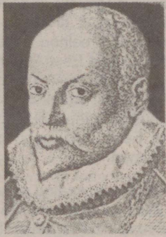
Orlando di Lasso