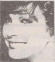
○ Shirley MacLaine

23.10 Kuidas elavad ja töötavad ameerika filmistaarid