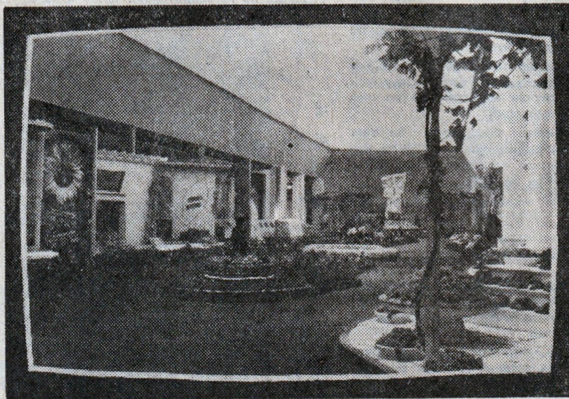
„СЕМЕНА В БРАЗДИТЕ“ (22. IX. 20.20 ч.)