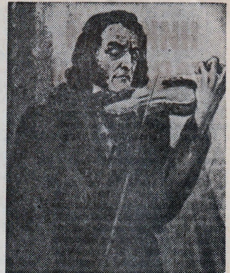
Николо Паганини (9.45 ч.)