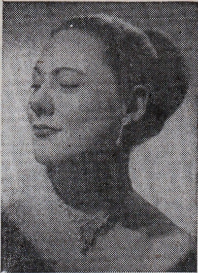
Рената Тебалди (19.00 ч., II пр.)

16.00 „АЛЕКСАНДЪР БОРОДИН“ — музикален портрет: 1. Симфонична картина „В степите на Средна Азия“, изп. симф. орк., дир. Претр; 2. Моминска стая, изп. Мария Максакова, съпр. Юртайкин — пиано, и Реентович — виолончело; 3. Скерцо, изп. на пиано Кримхилда Кристеску; 4. „Слава“ — хор из пролога на оп. „Княз Игор“, изп. солисти, хор и орк.