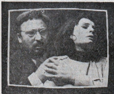
КАДЪР ОТ ПОСТАНОВКАТА

20.30 Телевизионният театър представя „КОГАТО ГРЪМ УДАРИ“ — от П. К. Яворов (повторение)