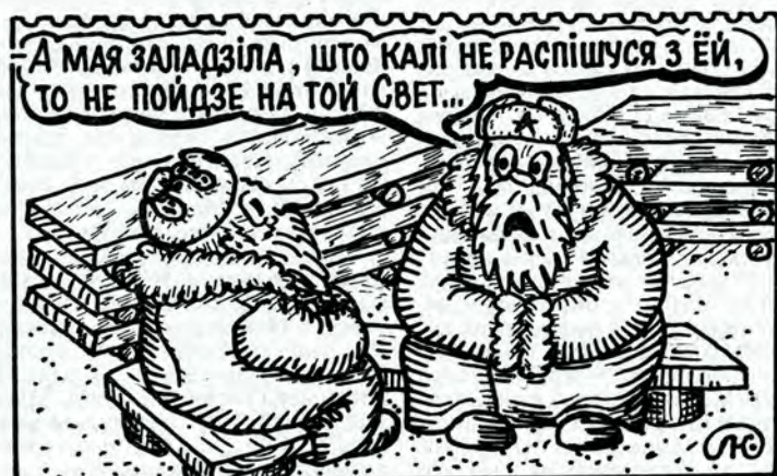
Малюнак Леаніда КАЛОДЗІНА.