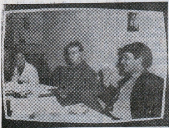
Творчески разговор на актьори, участници в постановката