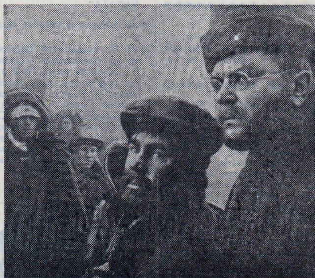
Ладър из филма „Война и мир“ („Бородино“, трета серия)

Молим участниците да уточняват своя адрес, възраст и професия.