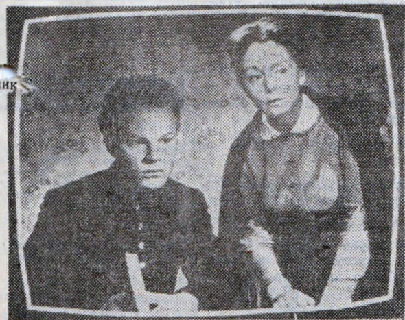
Кадър из филма „Сърцето на майката“

И така заповядайте на концерта „Песен на дружбата“ в неделя от 12.00 часа. Ще останете доволни от песните и танците, които ще чуете и видите.