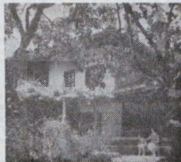
Панагюрище — къщата на Радина княгиня (25. X., 21.50 ч.)

20.35 „СЪРЦЕТО НА МАЙКАТА“ — съветски игрален филм 22.10 Преглед на програмата за следващата седмица 22.15 „СЕМЕЙСТВО КАЛИНКОВИ“