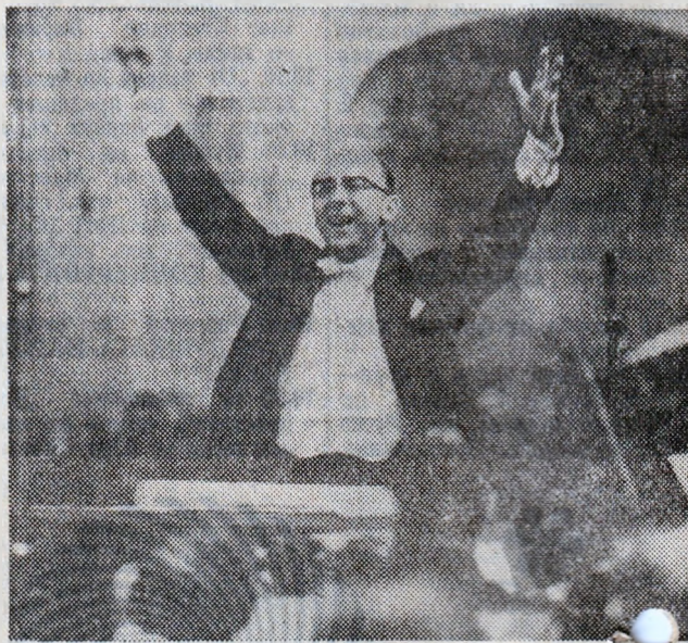
Дирижор Генеди Рождественски (19.20 ч., 11 пр.)

23.25 Из клавирното творчество на Александър Скрябин: 1. Соната за пиано № 3 във фа диез минор, изп. Леонид Зюзин; 2. Валс опус 38, изп. Дмитри Паперно; 3. Етюд в ре бемол мажор, изп. София Козма; 4. Три етюда ще изпълни Григори Гинзбург: Етюд в до диез мажор; Етюд в си минор; Етюд в ла мажор