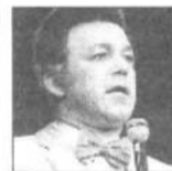
Иосиф КОБЗОН, певец.

– По стадиону что-то объявляют... Я, к сожалению, не очень хорошо знаю греческий язык. («Останкино», 1 канал).