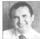
Николай ФЕДОРОВ, бывший министр юстиции.