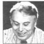
Владимир ПЕРЕТУРИН, спортивный комментатор.

– Для мастеров ракетки путешествовать по турнирам с любимой девушкой – это не примета, это потребность. (РТВ, из репортажей).