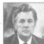
Илья ГЛАЗУНОВ, художник.

Конституция – это как винегрет... Кому картошка нравится, кому свекла. А кому таракан ползал. (НТВ, «Сегодня»).