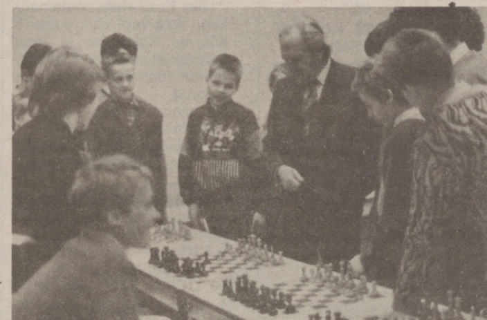
Fotol on ta Eesti Raadio Valges saalis malesõpradele simulaani andmas.