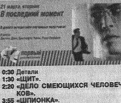
21 марта вторник В ПОСЛЕДНИЙ МОМЕНТ

6:00 «ШПИОНКА» 6:50 «Смешарики» 7:00 «Веселые мелодии»