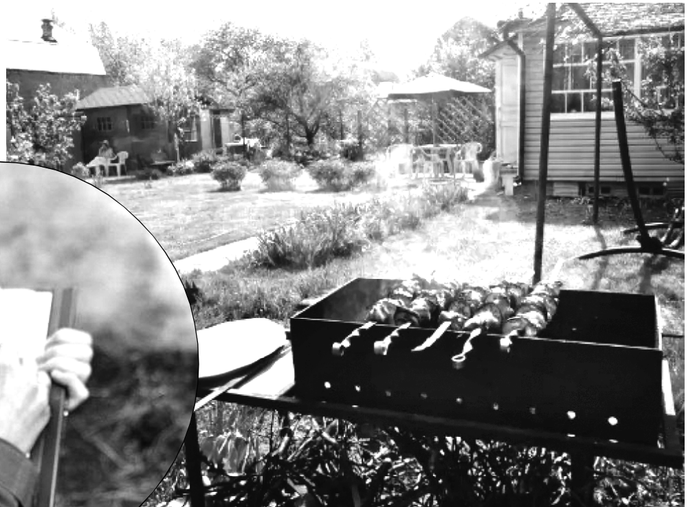
За нарушение требований пожарной безопасности налагается штраф