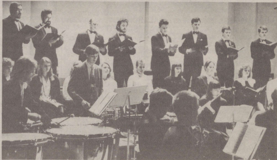
Eesti Raadio koor ja "Noorte Filharmoonia" mõnusat meeleolu loomas.

Tänavune Näärimuusika, arvult siis juba kuueteistkümnnes, pakkus kuulajatele kaks vaheldusrikka kavaga kontserti. Esimesel neist musitseerisid Eesti Raadio koor ja "Noorte Filharmoonia"