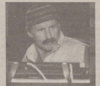
Mängib ansambel "Joe Zawinul Syndicate" K 23.30 (Tallinn 103,5 MHz)

18.30 NONSTOPPROGRAMM ROOTSI RAHVAMUUSIKAST 19.00 SOOME DIRIGENTIDE PÖLV- KÖNNAD, II. JUSSI JALAS JA LEO FUNTEK 21.00 Mängib Viinuse keelpillikvartett 22.00 "Vaba Euroopa" 23.00 - 1.00 RAADIO 7