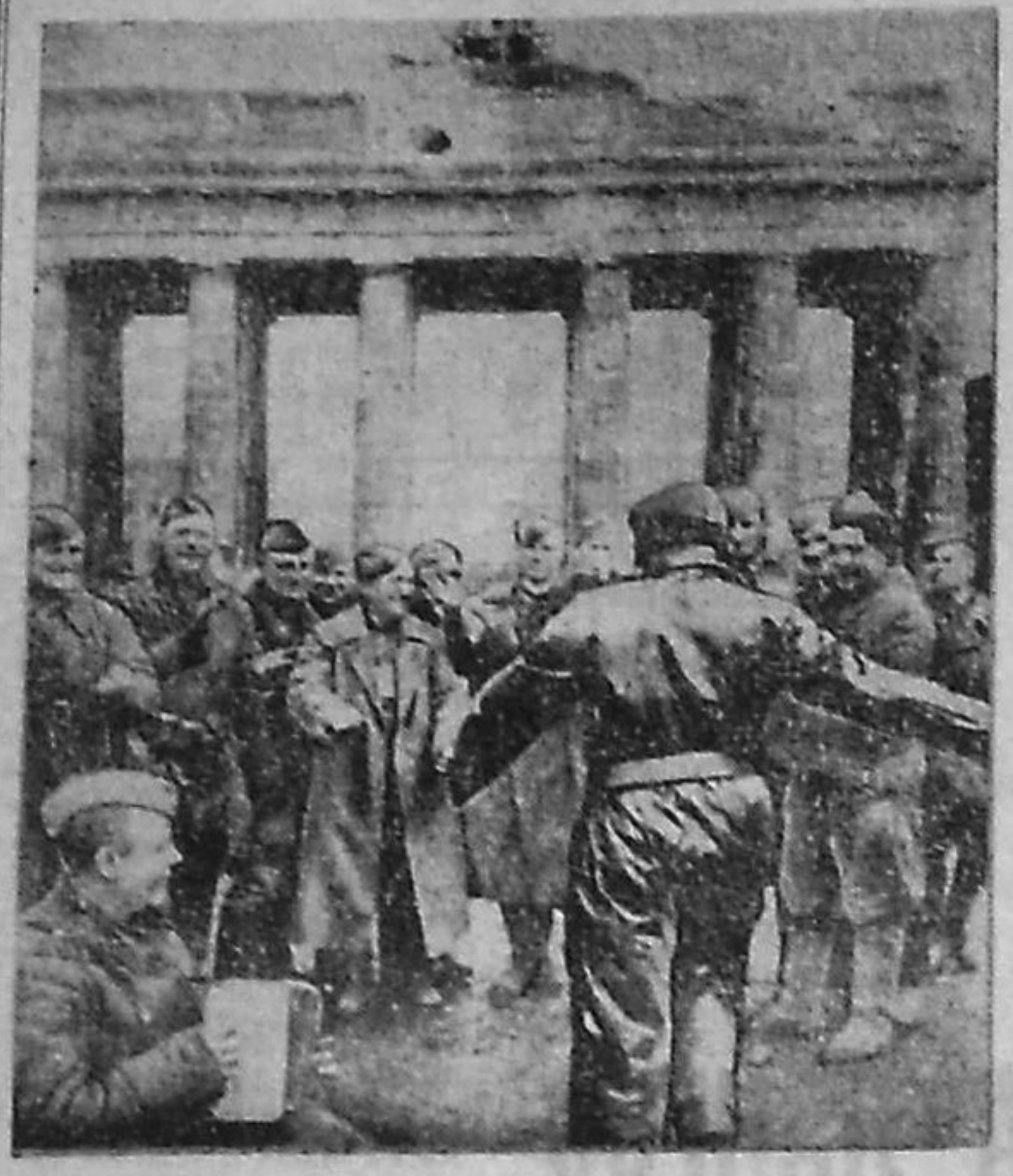
Снимкасонт: Берлин, 1945 нень май.

ульцесь боевой офицерсь полковниксь Чулс, шитесь, поповь лемдякшнык, кода минь лемдякшнык, поповь именьнять маласо паксейсонт, дивизионь вить флансонт, Шеленск пакс. Ансая кой-кува ульцесь а покш душминеть, конатне пешхельсь эрваа кодамо техникасо. Перть пелькясь чувновель-сонораель, Теса кельшеледьсь боеприпасонь складт, мухит, санчасть, штабт ды лият. Ды кода ансяк сась настулониянь часось, душмотнесь весе уликсь жывось бизмоладесь буто куткудавонь лизь. Эрва боедсь тейсь эсь тевенз.