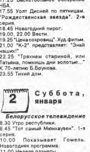
Рисунок Николая ГИРГЕЛЯ

10.00 Показывает Гомель. Новогодняя программа. 11.00 Неделя планеты.