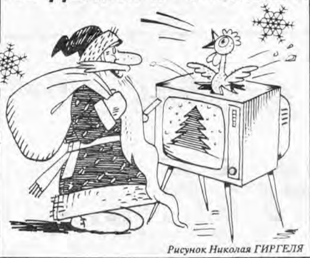
Рисунок Николая ГИРГЕЛЯ

20.55 Презентация "Кабачка на Таверской". 21.15 Шарман-шоу. Новогодний выпуск. Часть 1-я.