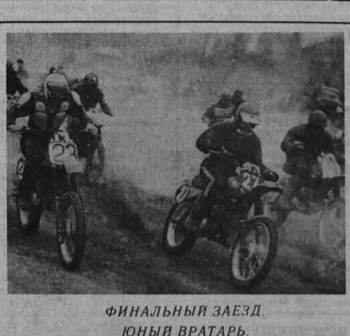
ФИНАЛЬНЫЙ ЗАЕЗД. ЮНЫЙ ВРАТАРЬ

ПО ВЕРТИКАЛИ: 1. Густое сладкое вещество. 2. Старинная испанская серебряная монета. 3. Точка орбиты Луны или Юпитера, наиболее удаленная от Земли. 5. Река, левый приток Нижнего Тунгуска в Красноярском крае. 6. Народность, живущая в низовьях р. Амура (прежнее название гилан).