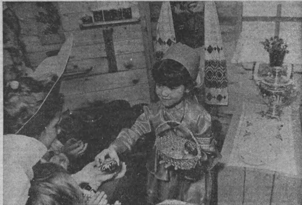
Так встречали весну в детском саду «Колокольчик». Вы видите фрагмент праздника, сценарий которого подготовили музыкальный руководитель Ж. Здорова и ее коллеги — воспитатели старшей и средней групп.