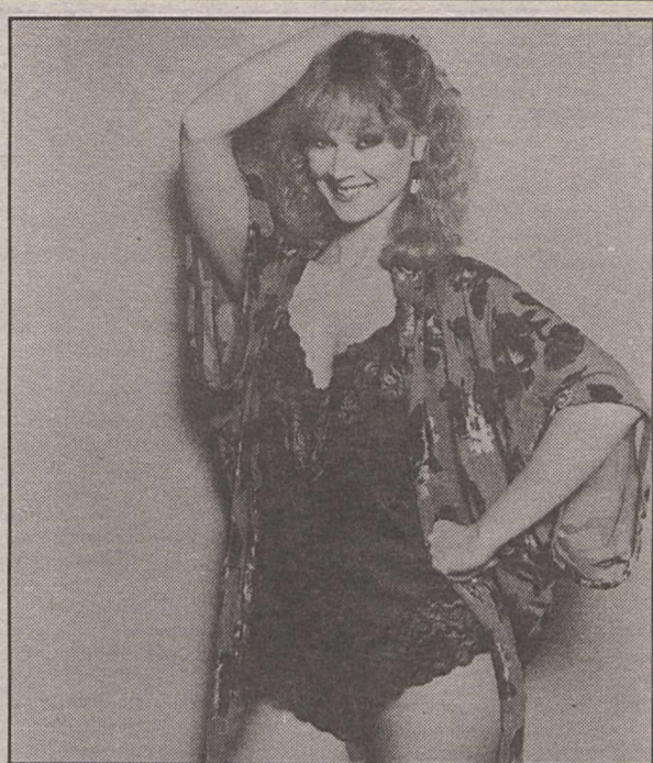
Shelley Long leikur vændiskonuna sem dregur peningasjúka og fljóthuga menn til samstarfs.