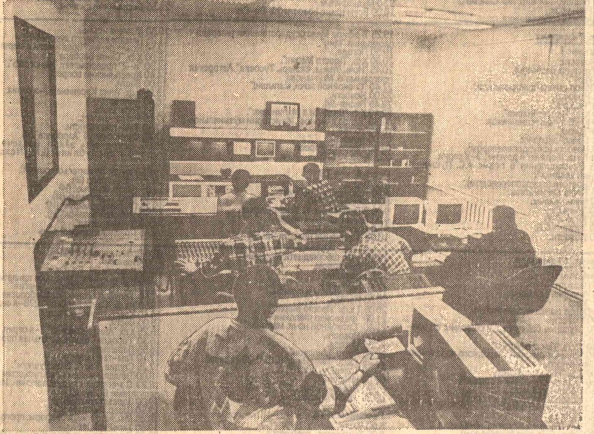
На снимках: последние дни перед выходом в эфир - готовность номер один.