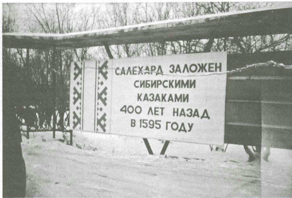
Незадачливый плакат не первый год красуется в районе Речпорта. Любой мало-мальски умеющий считать легко вычислит, что сегодня на дворе... 1995 год. Так что с Новым вас 1996 годом, дорогие салехардцы!