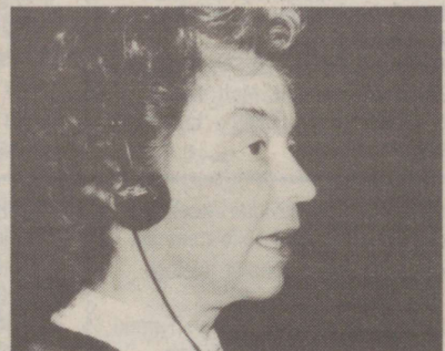
Age Raa: Nädala neljal öhtul räägime Eesti Poistekoorigest