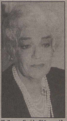
Kvikmyndin í kvöld var síðasta kvikmyndin er Simone Signoret lék í.

Leikhúsið er frönsk kvikmynd þar sem fylgst er með leikflokki einum sem á í erfiðleikum sumarið 1938. Nasistahreyfing er í uppgangi og margar hættur leynast, ekki síst fyrir gyðinga. Myndin gerist fyrst í Vín en síðan í París. Aðalpersóna myndarinnar er Yvonne Pierre, leikhússtjóri og fyrrverandi söngkona. Hún neitar að gefast upp þótt erfiðleikar stéðji hvaðanæva að. Við fylgjumst með henni dag eftir dag vinna bug á hræðslu sinni og erfiðleikum sem hlaðast upp... Aðalhlutverkið leikur Simone Signoret og varð þetta síðasta hlutverk þessarar dáðu leikkonu. -HK