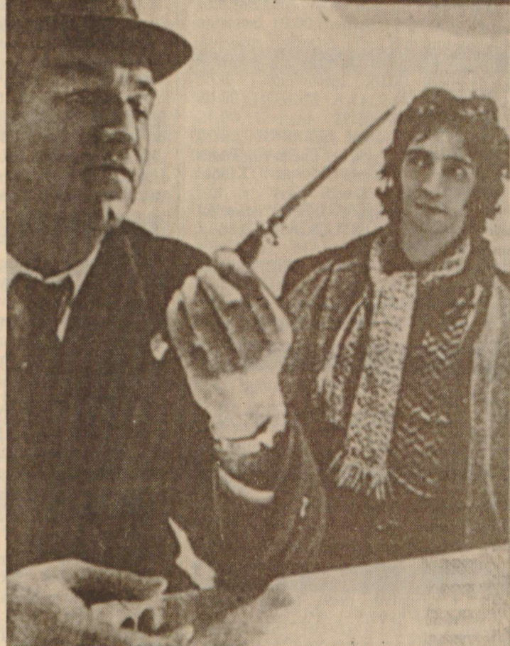
Kahekordne "Oscarit" laureaat Gene Hackman (vasakul) põnevusfilmis "Side läbi Prantsusmaa".

Tuntud juudi päritolu USA kineasti William Friedkini (1939) menufilmil äraostmatus Brooklyn narkopolitseinikust Jimmy "Popeye" Doyle'ist (Gene Hackman) võitis ühtekokku viis "Oscarit". Vägivaldsete töömoodide poolest tuntud võmm jahib halastamatult heroinaaga kaubitsiaid, kookumata tagasi millegi ees. Tema peatähelpanu koondub Marseille's resideeruva uimastikuninga Chamer' (hispaanlaste megastaar Fernando Rey, 1915—1994) kinninabimisele, mis ei osutugi nii kergeteks ettevõtmiseks. Friedkini ebatüüpilisele politseifilmile järgnes ri-burada põnevikku, mille peasangarit kujutati rohkete puudustega antikangelasena. Mister Doyle'i seiklused jätkuvad nädal hiljem (samal kellaa-ja) ekraaniteoses "Side läbi Prantsusmaa II" (1975), milles Marseille'sse reisinud nutikas politseinik püütakse lihtlaseks löksu.