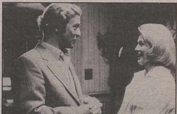
Michael Caine leikur sálfræðinginn Robert Elliott og Angie Dickinson leikur sjúkling hans.