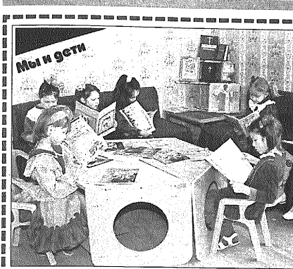
Мы и дети