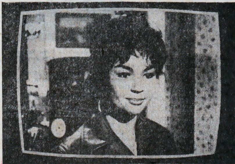
Кадър из филма „Кеат на разсъване“

15.50 Концерт на ансамбъла за песни и танци при Двореца на пионерите