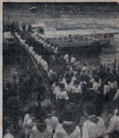
БУДАПЕЦА — посрещане на младежката радиоекспедиция „Дружба“ (21.50 ч.)