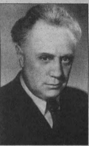
Михаил Жаров во время съемок в музыкальной комедии «Воздушный извозчик».

9.00 «Ведьмак» (Польша, 2001). Приключения. 49-й канал. 9.05 «Налево от лифта» (Франция, 1988). Комедия. 6.