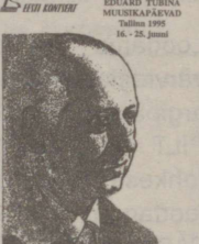
EDUARD TUBINA MUUSIKAPÄEVAD