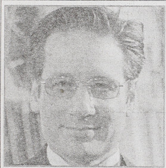
Devid Duhovni u seriji DOSIJE X TV Pink