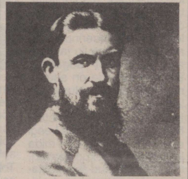
Bernard Shaw kolmekümneviieselt.