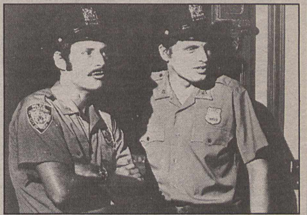
Lögregluþjónarnir fræknu á vakt.

aldna, á sjó og landi. Þeir sem vilja koma kveðjum til sjómanna geta skrifað þættinum og beðið um óskálög. Utanaskrift þáttarinnar er: Blítt og létt Útvarpshefningu Efstaleiti 1 150 Reykjavík