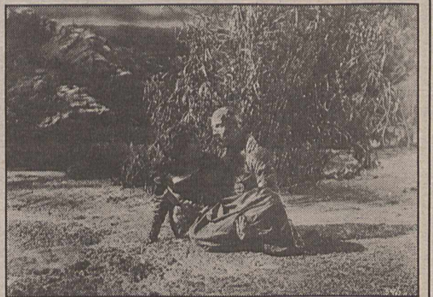
Hér hefur múmían fundið eitt fórnarlamb.