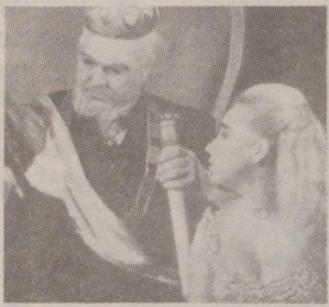
○ Hetk "Vanemuise" etenduselt aastast 1967.

Sellenädalane ooperiõhtu viib meid Valter Ojakäärü kaalukaima lavatöö - ooperi "Kuningal on külm" - radadele. Muidugi on selle ooperi aluseks A. H. Tammsaare samanimeline teos, mille tegelaste karakteritele on helilooja leidnud lakoonilised ja tabavad muusikalised vasted.