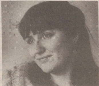
L 12 I, VR KULTUURIKAJA toimetab Kerttu Soans.

Saatepäeva toimetaja ja hommikukava juht on Herbert Tsukker 5.55 - 8.15 Hommikukava 13 Uudised. Ajakirjanduse ülevaade 13. 15 Faktid, sündmused, kommentaarid 13.20 Liiklusminutid 13.30 - 14 "Inimene ja loodus" 18 - 18.45 Päevakaja