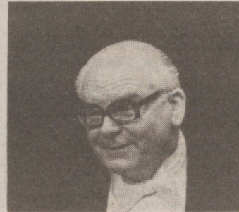
21.00 Kohtukroonika (kordus)