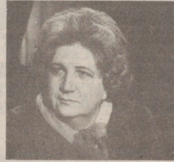
21.00 Juristi nõuanne (kordus)