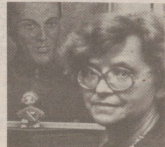
L 21.15 I INTERVJUUSID 1829.aastast on kogunud Helve Võsamäe.